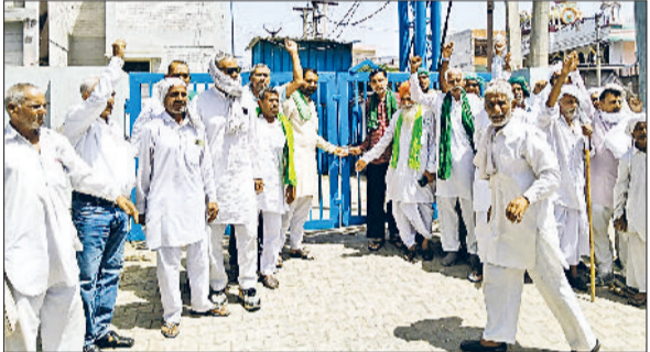
कलायत। मार्केट कमेटी कार्यालय पर ताला लगा प्रदर्शन करते भाकियू कार्यकर्ता।

जिसकी भरपाई के लिए किसानों को मुआवजा राशि देनी चाहिए। जब तक सरकार बायोमेट्रिक नियम को वापस नहीं लेती उनका आंदोलन जारी रहेगा। उन्होंने कहा मार्केट कमेटी द्वारा कार्यालय के साथ लगती बिल्डिंग पर किसान बनाए गए विश्राम गृह में किसानों के