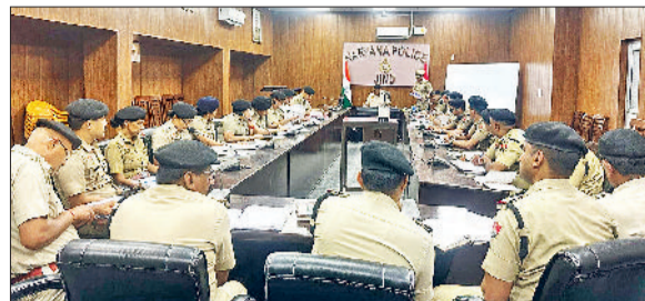
जौड़। बैठक में भाग लेते अधिकारी।

पुलिस द्वारा अपराध नियंत्रण कानून व्यवस्था को और अधिक प्रभावी बनाने तथा लंबित मामलों के त्वरित निपटान को लेकर पुलिस अधीक्षक कुलदीप सिंह द्वारा एक महत्वपूर्ण समीक्षा बैठक का आयोजन किया गया। इस बैठक में जिले के सभी थाना प्रभारियों, सभी पुलिस चौकी इंचार्ज सहित विभिन्न युनिट के इंचार्ज ने भाग लिया। बैठक के दौरान पुलिस अधीक्षक ने विभिन्न महत्वपूर्ण एजेंडा बिंदुओं पर विस्तार से समीक्षा करते हुए आवश्यक