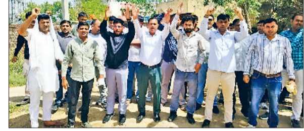
राजौद। मांगों को लेकर प्रदर्शन करते विद्युत प्रसारण निगम के कर्मचारी।

किसी विभागीय अनुमति के बिना कॉलोनियां काटी जा रही थीं। विभाग द्वारा एचडीआर एक्ट 1975 के तहत निवेशन जारी किए गए थे, लेकिन भू-मालिकों और प्रॉपर्टी डीलरों ने निर्माण कार्य जारी रखा। इसके बाद जिला डीसी की अनुमति से यह कार्रवाई अमल में लाई गई।