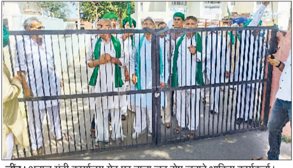
जींद। अनाज मंडी कार्यालय गेट पर ताला जड़ रोष जताते भाकियू कार्यकर्ता।