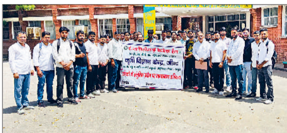
जौड़। कार्यक्रम में भाग लेते किसान।