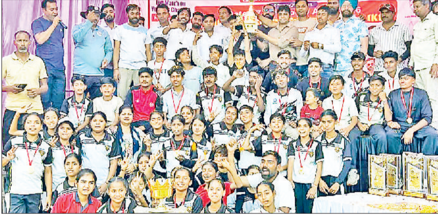
सीवन। सीवन में आयोजित प्रतियोगिता के विजेता टीमों के साथ आयोजक।