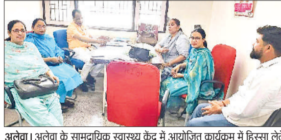
अलेवा। अलेवा के सामुदायिक स्वास्थ्य केंद्र में आयोजित कार्यक्रम में हिस्सा लेते स्वास्थ्य कर्मचारी।

लेने से वंचित रह जाता है तो वह किसी भी अन्य दिवस पर ये दवाई किसी भी सरकारी स्वास्थ्य केंद्र से प्री में ले सकता है। एक से दो वर्ष तक के बच्चों को आधी गोली तथा दो से 19 वर्ष