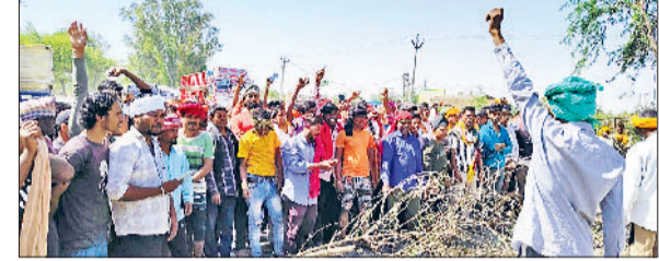
कैथल। जींद मार्ग पर जाम लगाते मजदूर।