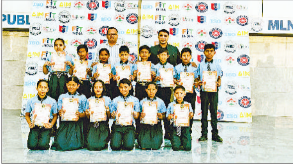
जौड़। विजेता बच्चों को सम्मानित करते हुए।

मोतीलाल नेहरू पब्लिक विद्यालय में विद्यार्थियों की रचनात्मक प्रतिभा को प्रोत्साहित करने एवं उन्हें अंतरराष्ट्रीय मंच पर अपनी कला का प्रदर्शन करने का अवसर प्रदान करने हेतु इंटरनेशनल लेवल टैलेंट सर्च प्रतियोगिता का आयोजन किया गया। कार्यक्रम का उद्देश्य विद्यार्थियों के भीतर छिपी सृजनात्मक क्षमताओं को पहचानना, उन्हें निखारना तथा आत्मविश्वास के साथ अपने कौशल का प्रदर्शन करने के लिए प्रेरित करना था। इस प्रतियोगिता को चार प्रमुख श्रेणियों में विभाजित किया गया। जिनमें पेंटिंग, हैंडड्राइंग, ड्राइंग एंड प्रिंटिंग तथा रंगोली शामिल थी। प्रत्येक श्रेणी में विद्यार्थियों ने बहुरूपी भाग लिया और अपनी कल्पनाशक्ति, सौंदर्यबोध तथा कलात्मक दक्षता का अद्भुत परिचय दिया। पेंटिंग