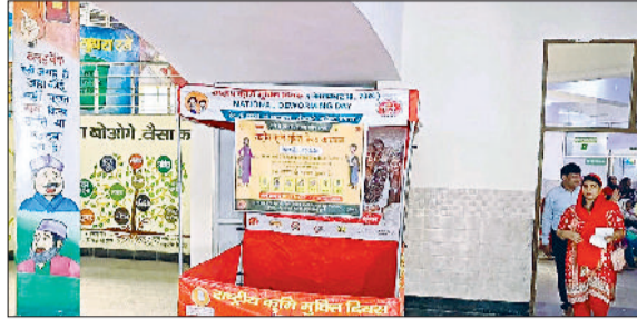
जीद। अस्पताल में लगाई गई कनूपी।